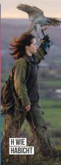
H WIE HABICHT